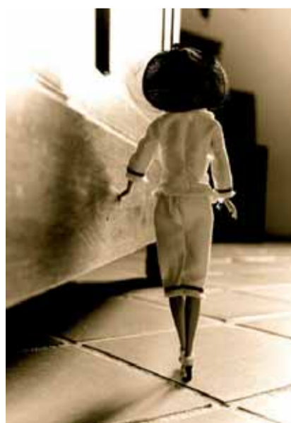
Emilie Chacon : stand 404