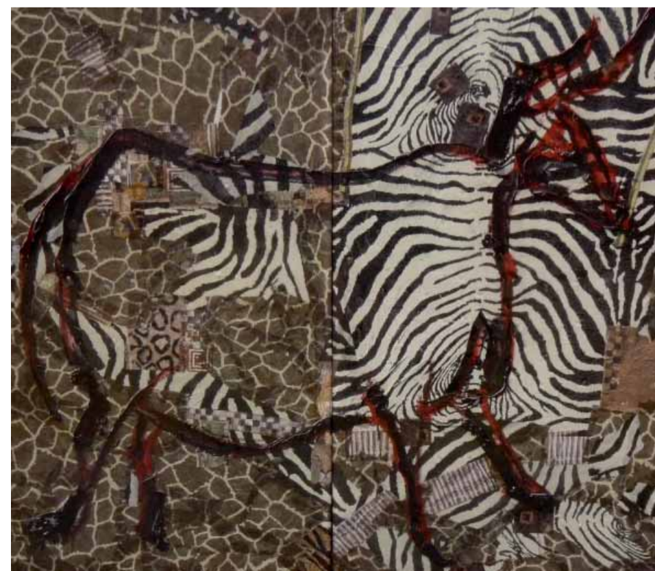
Vérobé "Lascaux" : stand 312

A travers son art, elle communique ses rêves, ses passions, ses amours... tout comme dans ses sculptures, ses personnages ou ses couples qui viennent d'ailleurs... et apparaissent surnaturels pour laisser place à des réalisations qui sont à découvrir pour leur richesses émotionnelles.