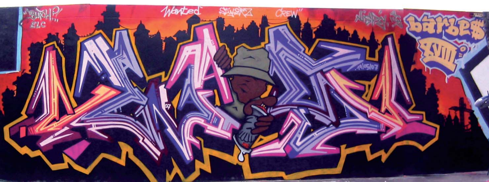
Butch et Pea